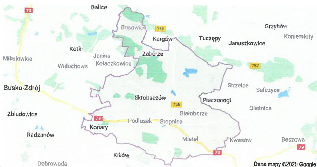
Rysunek Nr 1. Lokalizacja Gminy Stopnica.

Gmina Stopnica jest gminą miejsko-wiejską położoną w południowo-wschodniej części województwa świętokrzyskiego, należy do powiatu buskiego. Oddalona jest 65 km od Kielc - stolicy województwa, 55 km od Tarnowa, 100 km od Krakowa, 17 km od Buska-Zdroju - siedziby władz powiatu i 22 km od Staszowa. Lokalizację Gminy Stopnica prezentuje zamieszczona poniżej mapa.